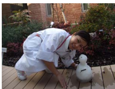
中庭に夜勤ナースの雪だるま

「患者さんが喜んでくださると思って雪が解けないうちに作りました！」なんとも愛らしい表情の二人です。