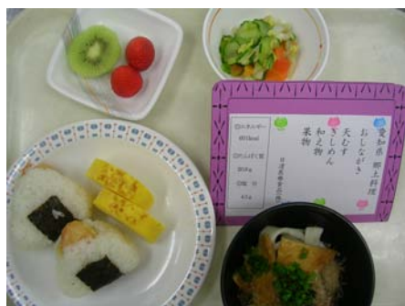
4月14日行事食は愛知県郷土料理

上山病院病棟では、節分や七草などさまざまな行事にちなんだ食事や郷土食などを提供する「行事食」メニューを毎月数回企画して、病棟患者様に召し上がっていただいています。