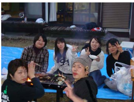
青空の下のバーベキューは格別です

4月3日(土)4日(日)の2日間、霧島山荘にて、毎年恒例の新人宿泊研修が実施されました。前日までの雨がうそのような快晴の青空のもと、まずは霧島神宮駅から霧島神宮まで徒歩移動。神宮でお祓いを受けたあと、神宮周辺の清掃を行いました。山荘に戻って、夕方から