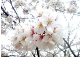
吉野公園のソメイヨシノ

桜の季節がやってきました。お花見は行かれたでしょうか。桜といえばソメイヨシノが一般的で、桜の開花予想はソメイヨシノの開花具合を基準とされていますが、そのソメイヨシノは、実は自然に繁殖することができません。受精することができず、人間の手で接木もしくは挿し木などで繁殖し、日本全国に植樹されているそうです。接木や挿し木は増やしているということは、全国のソメイヨシノは同じ木＝「クローン」ということになります。クローンであるがゆえに、地域差はありますが、同じ地域であればいっせいに開花するのだと言われています。