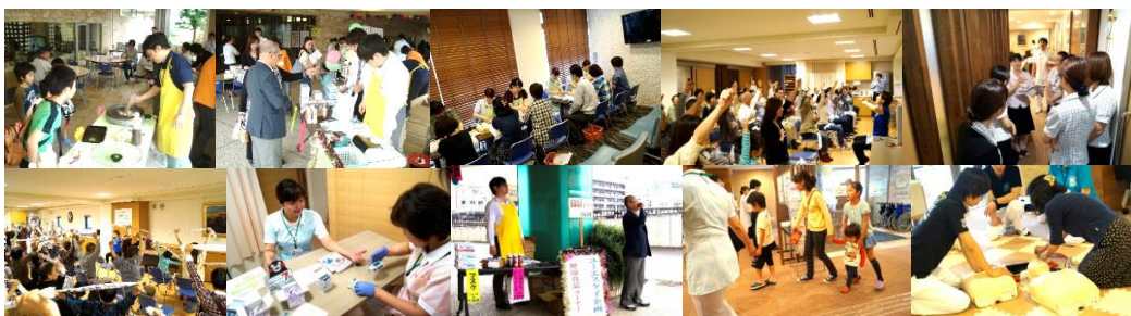
昨年の健康まつりの様子

腎愛会の各部署から集まった精鋭スタッフが、様々なコーナーを計画しており、楽しい催しとなるとおもいます。楽しみにお待ちしております。