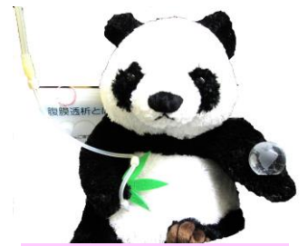
当院の腹膜透析説明用 パンダ君