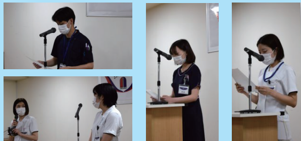
プリセプターを務めた先輩より激励の言葉も